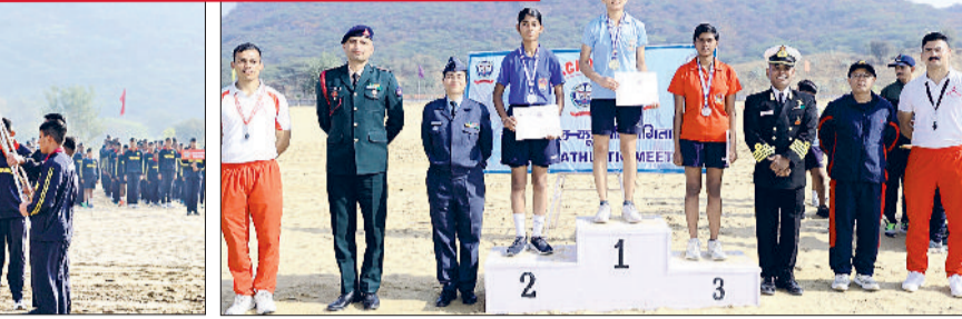
रेवाड़ी। खेल भावना की शपथ लेते हुए कैडेट्स तथा विजेता कैडेट्स को सम्मानित करते प्राचार्य व स्टाफ।