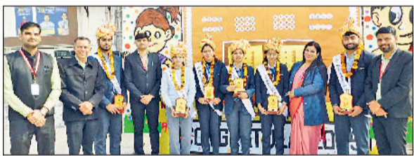
रेवाड़ी। परीक्षा में सफल रहे विद्यार्थियों का सम्मान करते शिक्षक।