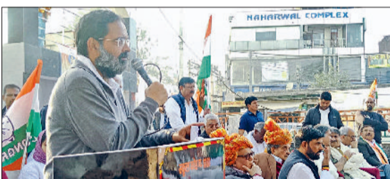
रेवाड़ी। बावल में जनसभा को संबोधित करते कांग्रेस नेता चौ. बृजेंद्र सिंह।

पूर्व सांसद व कांग्रेस नेता चौ. बृजेंद्र सिंह ने कहा कि कांग्रेस के शासनकाल में शुरू की मनरेगा योजना को भाजपा ने सत्ता में आते ही वर्ष 2014 में खत्म करने के प्रयास किए थे। अब इस योजना का नाम बदलकर इसके पैकअप की तैयारी की जा रही है। चौ. बृजेंद्र सिंह अपनी सद्भाव यात्रा के दौरान बावल हलके में आयोजित सभाओं को संबोधित कर रहे थे। उन्होंने कहा कि पहले मनरेगा का पूरा पैसा केंद्र सरकार खर्च कर रही थी। अब इसका 40 प्रतिशत हिस्सा प्रदेश सरकार को वहन करने का निर्णय लिया गया है। प्रदेश सरकार का खजाना पहले ही खाली पड़ा हुआ है, जिस कारण यह योजना जल्द