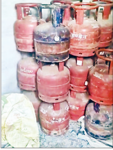
रेवाड़ी। भगवानपुर स्थित अवैध गोदाम में रखे छोटे गैस सिलेंडर, जब किए गए गैस सिलेंडर तथा गोदाम में रखा सिलेंडर रिफिलिंग का सामान।

सदर थाना पुलिस ने भगवानपुर गांव में एलपीजी के अवैध गोदाम का भंडाफोड़ किया है। गोदाम में बड़े सिलेंडरों से छोटे सिलेंडर रिफिल करने का धंधा चलाया जा रहा था। इस धंधे को पिता-पुत्र अंजाम दे रहे थे, जो पुलिस की रेड पड़ते ही फरार होने में कामयाब हो गए। पुलिस ने मौके से 177 गैस सिलेंडर व दो वाहन सहित सिलेंडर रिफिल करने का सामान भी बरामद किया है।