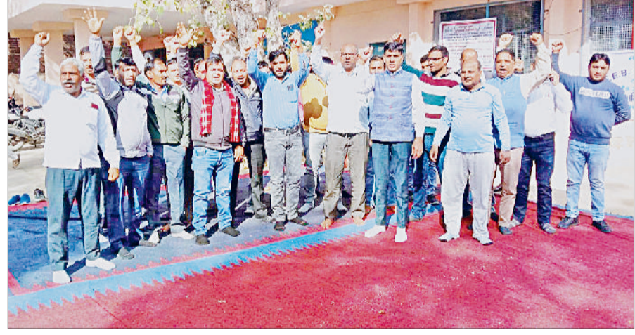
नारनौल। ऑनलाइन पॉलिसी के विरोध में नारेबाजी करते बिजली कर्मचारी।