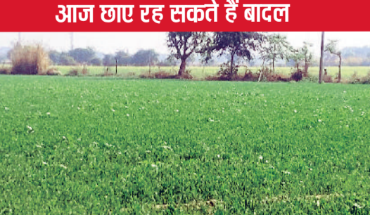
रेवाड़ी। एक खेत में प्रगति की ओर अग्रसर गेहूँ की फसल।

जल्द देखने को मिल सकता है। दिसंबर माह के पहले सप्ताह के बाद से दिन के समय तेज धूप निकलने के कारण मौसम गर्म बना रहता है। रात के समय कड़ाके की ठंड और दिन में गर्म मौसम लोगों को बीमार करने का कारण बन रहा है। वीरवार को सुबह से ही आसमान साफ रहा। एक बार फिर तेज धूप ने मौसम को गर्म बनाए रखा, लेकिन अन्य दिनों की तुलना में मौसम ठंडा रहा। अधिकतम तापमान 0.6 डिग्री की मामूली कमी के साथ 24.0 डिग्री सेल्सियस आ आ गया। न्यूनतम तापमान भी 0.7 डिग्री सेल्सियस