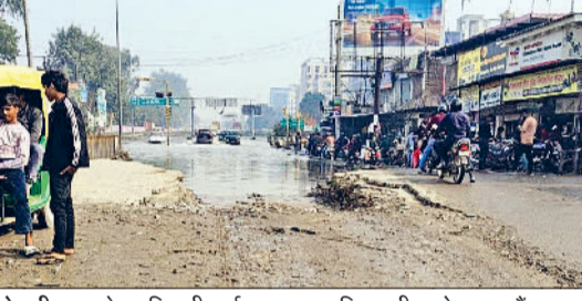
रेवाड़ी। धारूहेड़ा-भिवाड़ी बार्डर पर जमा दूषित पानी व तोड़ा गया रैंप।

जून माह में सीएम नारायण सिंह सेनी के रेवाड़ी आगमन पर तिजारा के विधायक बाबा बालकनाथ भी कार्यक्रम में मौजूद थे। धारूहेड़ा में दूषित पानी रोकने के लिए बनाए गए रैंप को तोड़ने के प्रयासों को लेकर राव इंद्रजीत सिंह ने बाबा बालकनाथ के समक्ष कड़ी आपत्ति जताते हुए इस तरह की कार्रवाई को बर्दाश्त नहीं करने की बात कही थी। इसके बाद राजस्थान के सीमावर्ती गांवों के लोग रैंप तुड़वाने को लेकर लामबंद हो गए थे।