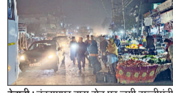
रेवाड़ी। नंदरामपुर बास रोड पर लगी सब्जीमंडी व वाहनों की लगी कतार।